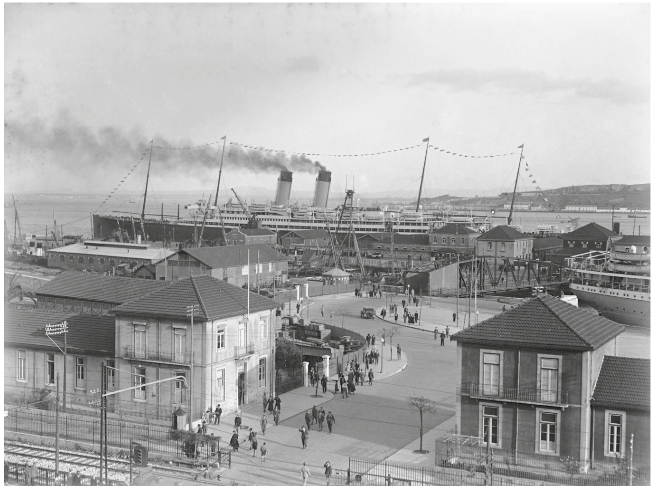
Vista do muro-cais da Rocha fotografada das escadinhas da Rocha do Conde d'Óbidos • Sem data